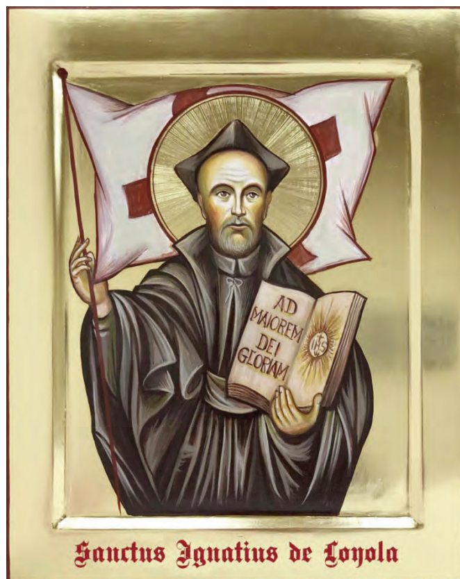
Sanctus Ignatius de Loyola

Czy idę za Jezusem bezinteresownie czy raczej oczekuję gratyfikacji (jakich)? Co jest mi najtrudniej oddać Bogu? Jakiego stokroć doświadczyłem dotychczas od Pana Boga?